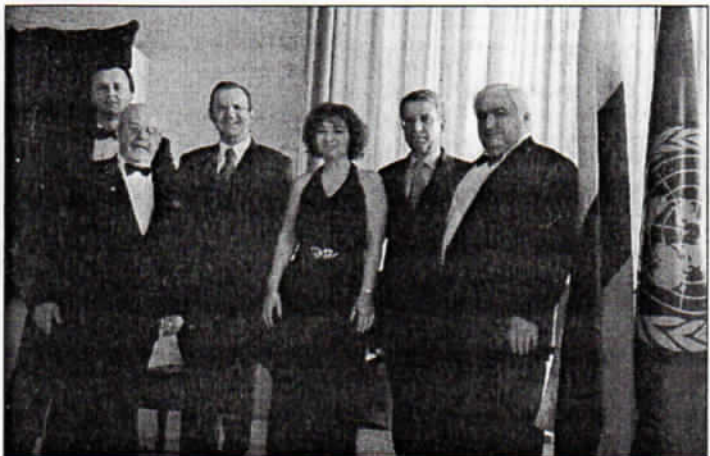
Участники и гости концерта